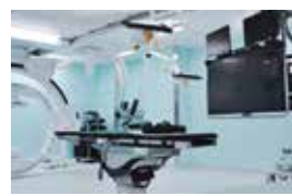
栃木県北唯一の「ハイブリッド手術室」