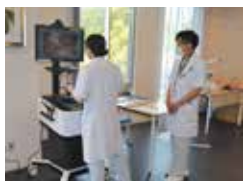
腹腔鏡シミュレータ

■ほかにも 高齢者体験や模擬検査体験、車いす体験など、予約不要・年齢性別不問の体験イベントをご用意しています。