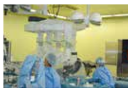
手術支援ロボット「ダビンチ」

※各種イベントには、事前に申し込みが必要なものもございます。詳しくは、プログラムをご参照ください。