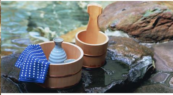
塩原御用邸（左）と温泉