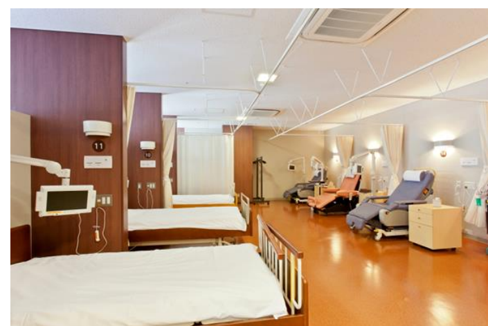
外来化学療法室（14床）