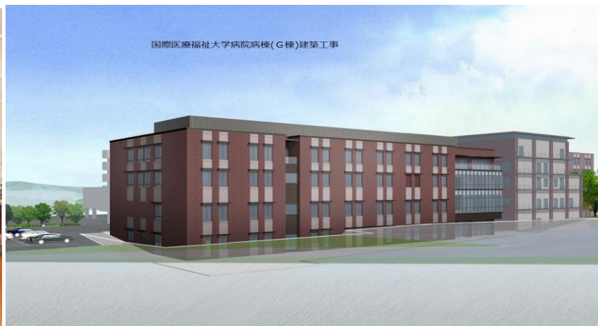
国際医療福祉大学病院（増床予定図）